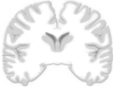
Document 1 : Coupe transversale médiane du cerveau

On veut étudier l'anatomie du cerveau et de la moelle épinière chez l'Homme. Pour cela, des schémas d'une coupe transversale médiane du cerveau et d'une coupe transversale de la moelle épinière sont mis à ta disposition (Documents 1 et 2).