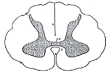
Document 2 : Coupe transversale de la moelle épinière